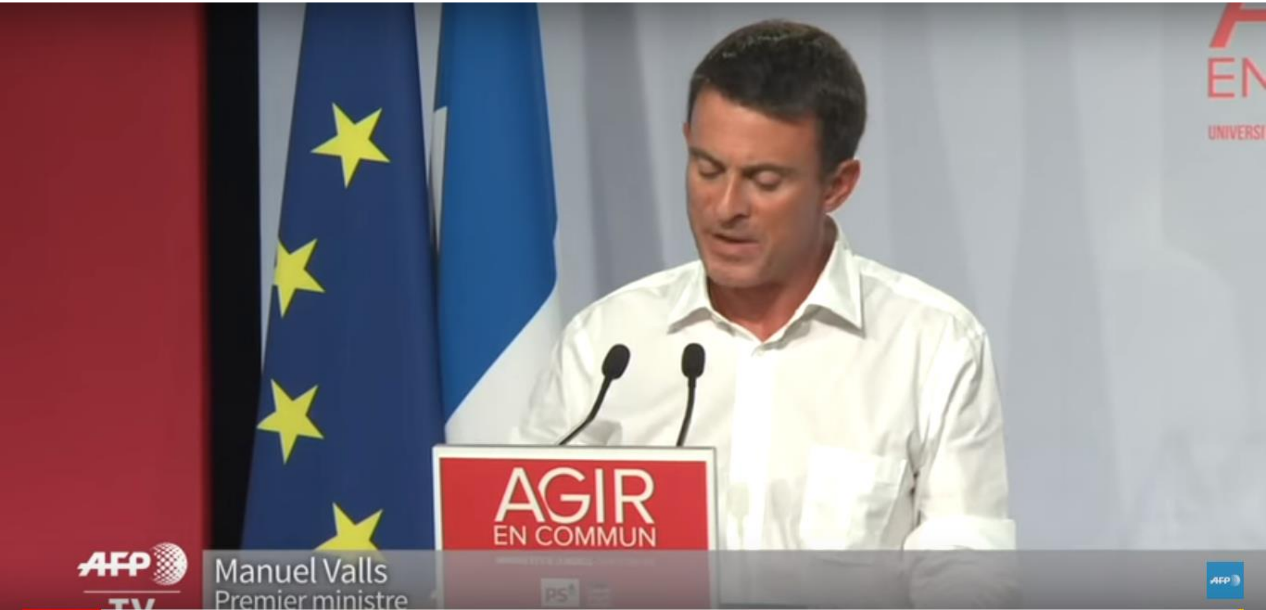
Manuel Valls Premier ministre